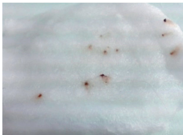
Рисунок 3: Фекалії бліх, що містять кров, підтверджується додаванням води