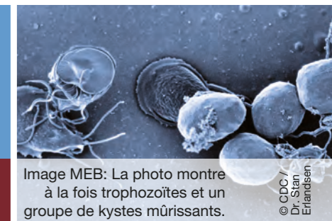
Image MEB: La photo montre à la fois trophozoïtes et un groupe de kystes mûrissants.

Extrait révisé du Guide de recommandations ESCCAP no. 6 pour la Suisse: «Lutte contre les protozoaires intestinaux du chien et du chat»