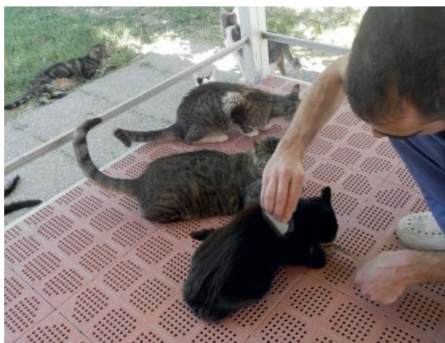
2. ábra: Bolhafésű alkalmazása

Erősen mozgó bolhák feltűnő jelenlétének hiányában a bolhaürülék mutatható ki az állat megfésülésével, és az összegyűjtött anyag nedves, fehér papírra, anyagra vagy pamutvattára helyezésével: a bolhaürülék fekete foltjait emésztetlen vérből álló vörös gyűrű veszi körül.